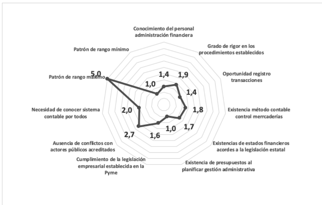
Figura 2 Estado de las Pymes encargadas de la distribución de los derivados lácteos en el desempeño contable-financiero

Tal desglose de variables por cada Pyme, permite mostrar el estado global de cada una a partir del gráfico de araña mostrado en la Figura 2. Es destacado que al máximo valor de 5 puntos, la media obtenida general es de 1,79, apenas alcanza los 2 puntos. Estos resultados reflejan la necesidad y alerta de propiciar herramientas y servicios de asesorías integrales a las Pymes encargadas.