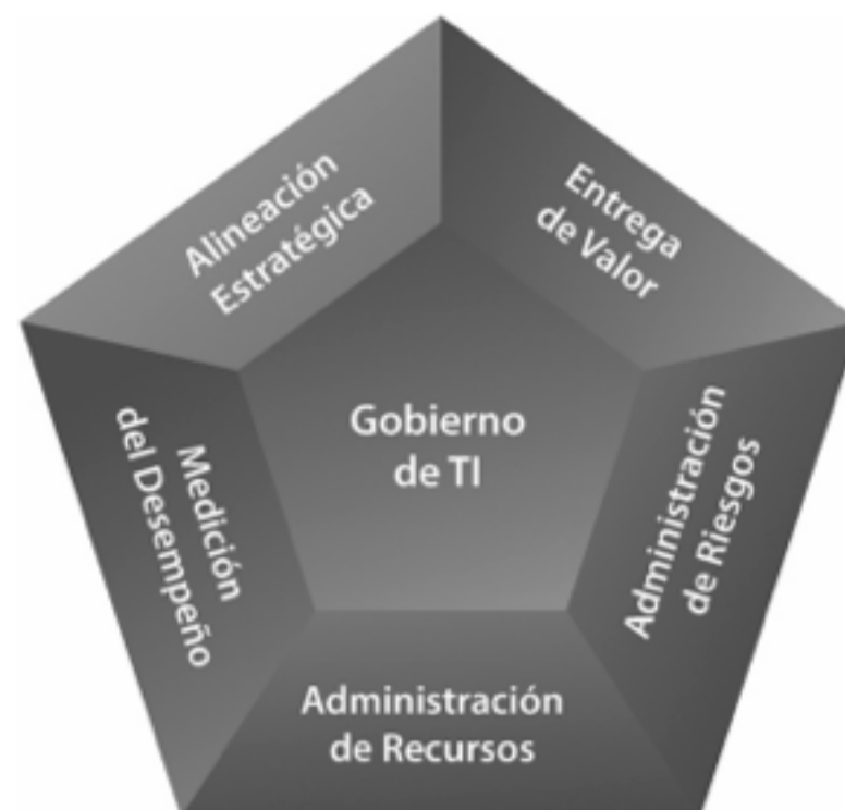
Figura 1. Áreas de enfoque del gobierno de TI (ITGI, 2007)

áreas de enfoque que son ilustradas en la Figura 1 (ITGI, 2007):