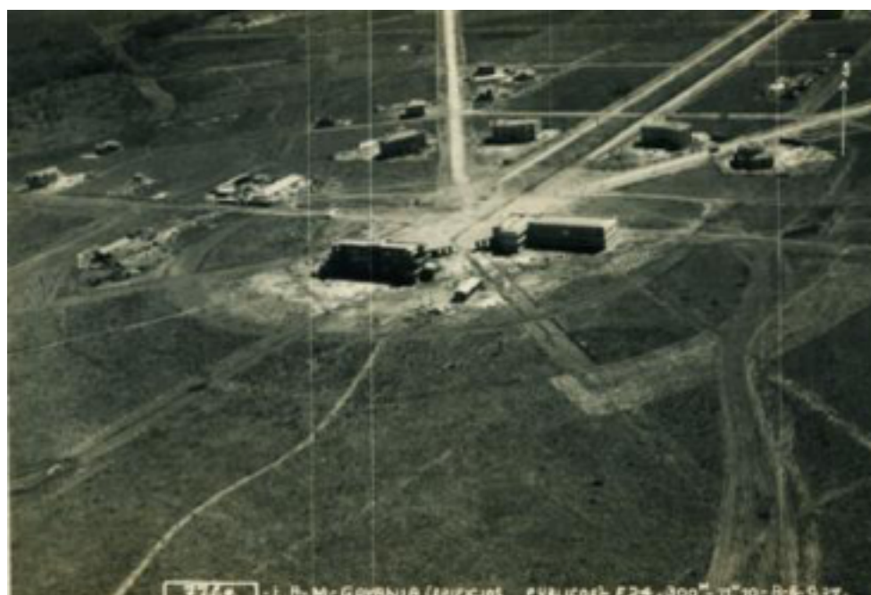
Figura 1 - Vista aérea do centro de Goiânia ainda em implantação.

A estrutura urbana proposta por Attílio pode ser descrita através de dois eixos perpendiculares entre si: o Norte-Sul e o Leste-Oeste, que atravessam toda a cidade. O traçado escolhido foi o radiocêntrico, que possuiu como ponto focal a Praça Cívica e que definiu três grandes áreas: Setor Central, Setor Norte e Setor Sul. Nas intenções do urbanista, o traçado da cidade obedeceu de maneira geral à configuração do terreno, às necessidades do tráfego e ao zoneamento.