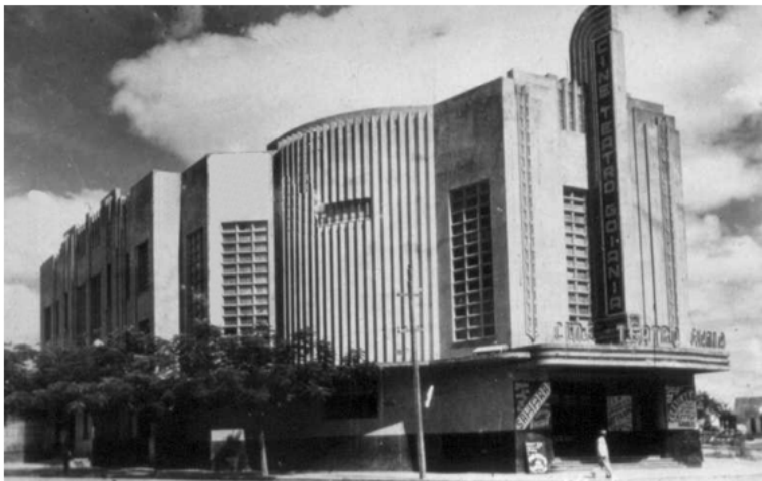
Figura 7 - Foto Teatro Goiânia, década de 1950.

O edifício do Teatro Goiânia foi projetado pelo engenheiro arquiteto Jorge Félix de Sousa e José Amaral Neddermeyer e inaugurado em 1942. Possui uma composição original e inovadora, marcado pela presença das curvas na fachada principal e riqueza de detalhes. Interessante notar que toda a ornamentação está aplicada somente nas laterais e principalmente na fachada frontal. O fundo do teatro não possui ornamentação nem acompanha as linhas movimentadas que marcam a sua identidade formal. Confirmando, assim, a lógica de implantação dos edifícios nas quadras projetadas por Attílio, onde o fundo não era para ser visto. As quadras eram para serem adensadas, apropriadas por edifícios em toda a sua extensão.