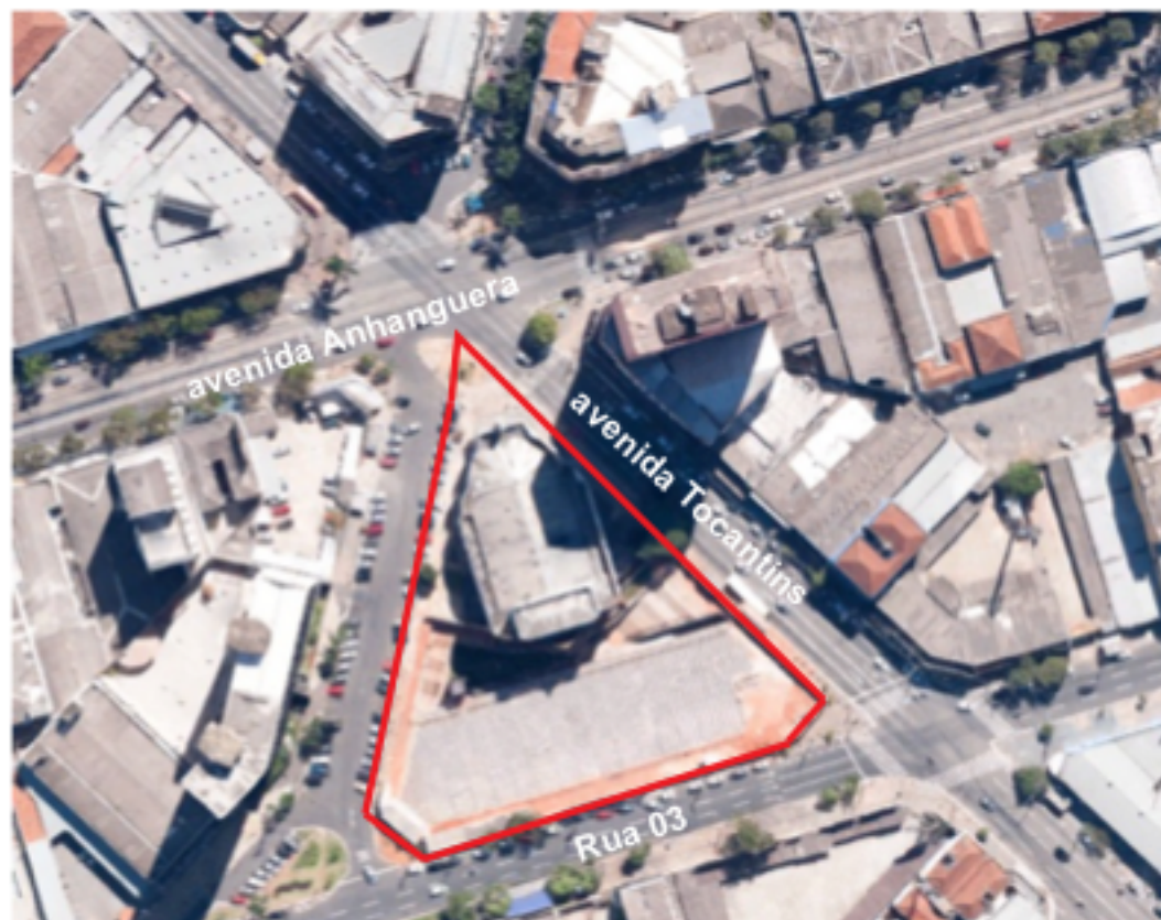
Figura 5. Vista aérea da quadra do Teatro Goiãna.

um espaço multifuncional projetado para receber atividades culturais. Esse empreendimento foi inaugurado em outubro de 2013, quando a cidade completou 80 anos. A Vila, de acordo com o Estado, "se insere na ação do Governo estadual para revitalizar o Centro de Goiânia e resgatar a memória da capital" (Segplan, 2013). Entretanto, é estranho constatar que, em nome do discurso de resgate da memória local, foram demolidos todos os edifícios que faziam parte da quadra, dentre eles exemplares interessantes da arquitetura residencial dos primeiros anos da cidade.