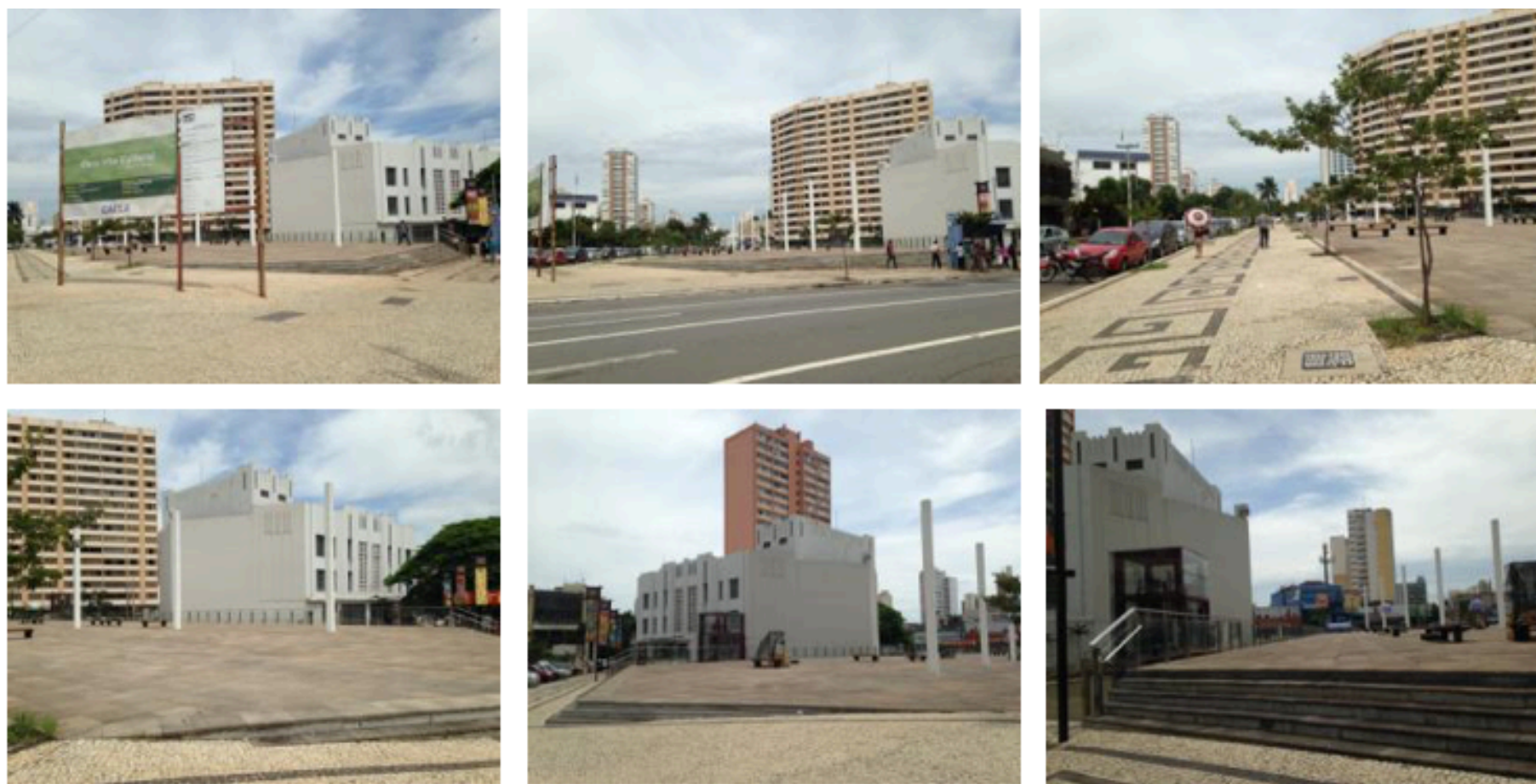
Figura 6 - Sequência de imagens da quadra 67 no Centro de Goiânia, onde é possível ver os fundos do Teatro Goiãna e a praça seca finalizada em 2013, que modificou a morfologia original do Plano inicial da cidade.

Uma obra desse porte, em uma área de interesse histórico e cultural, dentro do perímetro de