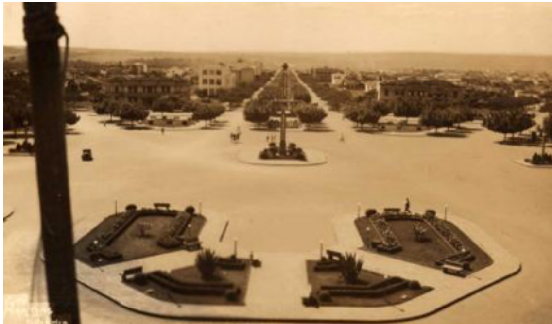
Figura 2 - Praça cívica com as três principais avenidas, vistas do terraço do Palácio das Esmeraldas. Goiânia.

A escolha do local para implantação da praça cívica foi fundamental para garantir o destaque que se pretendia, e que deveria sobressair visivelmente de todos os pontos da cidade. Por isso a justificativa de Attílio em tirar partido da topografia para realçar o centro administrativo, o principal motivo da nova cidade. A ossatura da cidade é definida, além da Praça Cívica, por amplas avenidas, que além de formarem importantes eixos visuais são a base de distribuição do tráfego e controle de escoamento para o futuro, tendo em vista sua localização em relação ao centro.